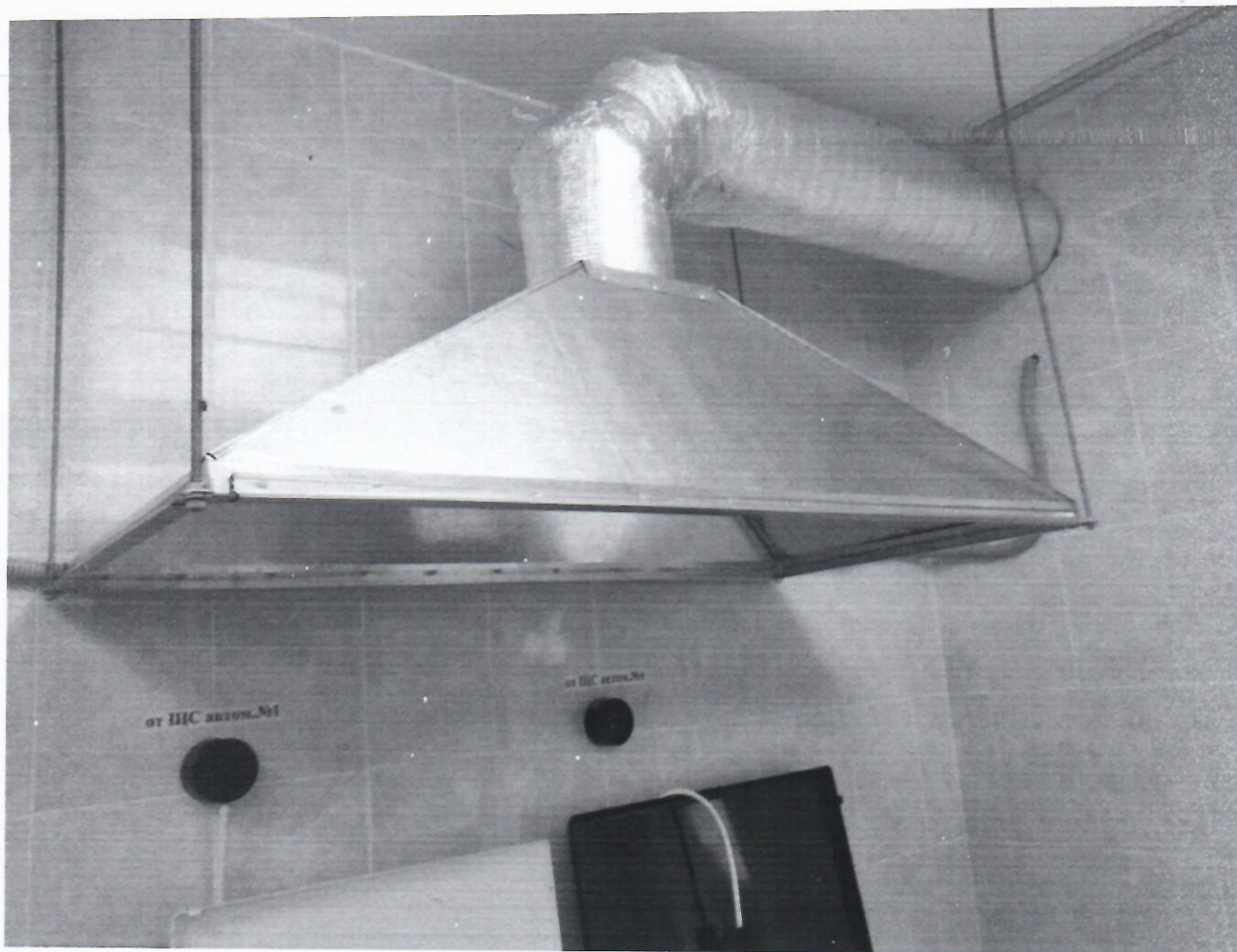
Установлена вытяжная система в пищеблоке